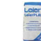
LeierPLAN vékony falazóhabarcs