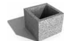
Leier beton pillérzsaluzó elem