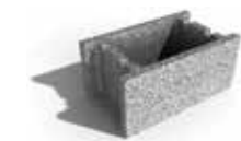
Leier beton zsaluzóelem