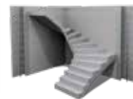
ELŐREGYÁRTOTT FALAK ÉS LÉPCSŐK