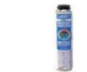
LeierFIX univerzális építési ragasztó