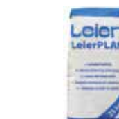
LeierPLAN vékony falazóhabarcs