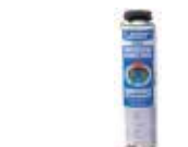
LeierFIX univerzális építési ragasztó