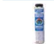
LeierFIX univerzális építési ragasztó