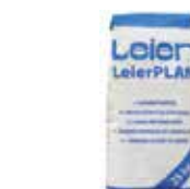
LeierPLAN vékony falazóhabarcs