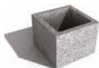
Leier beton pillérzsaluzó elem