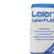
LeierPLAN vékony falazóhabarcs