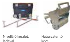
Nivelláló készlet, ládával