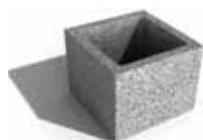
Leier beton pillérzsaluzó elem