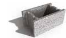
Leier beton zsaluzóelem