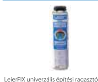
LeierFIX univerzális építési ragasztó