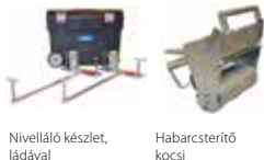
Nivelláló készlet, ládával